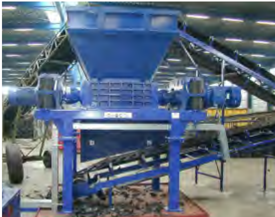
Abfälle werden durch den Zerkleinerer auf eine Korngrösse \approx 400 mm reduziert.

die Fraktion \approx 100 mm wird mittels Trommeltrenner Typ NIHOT Single-Drum Separator in eine hochkalorische Leichtfraktion und eine Schwerfraktion aufgeteilt.