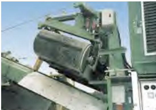
Magnetische FE-Teile werden mit dem Überbandmagneten aussortiert.