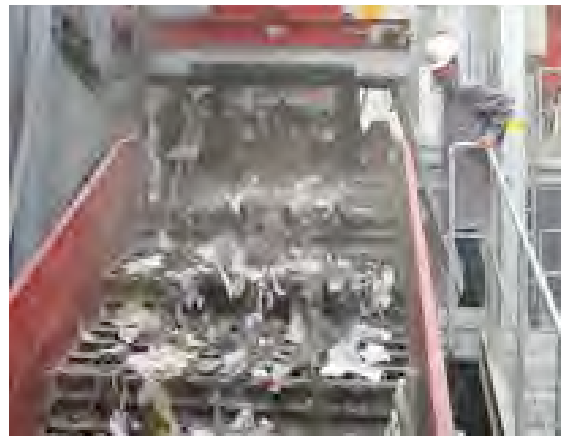
Müllsieb mit gemischten Gewerbe- und Baumischabfällen.