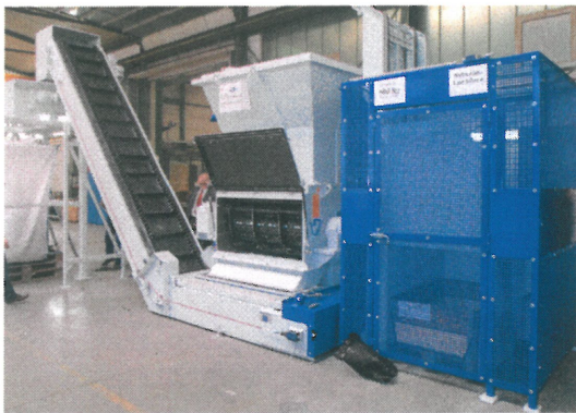
Der Vecoplan VAZ 1300 SK mit Hub- Kipp- einrichtung, Anfuhrband und Big-Bag- Abpackstation