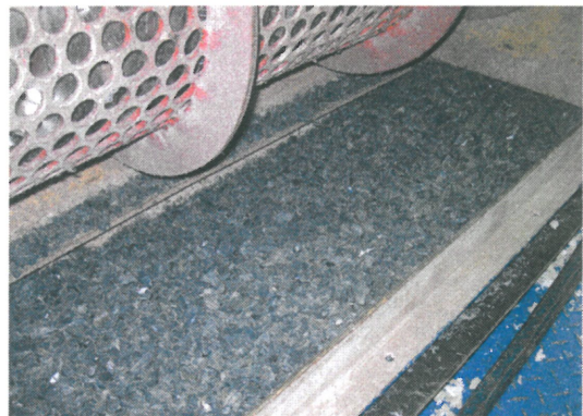
Outputmaterial mit Korngrösse \approx 40 mm