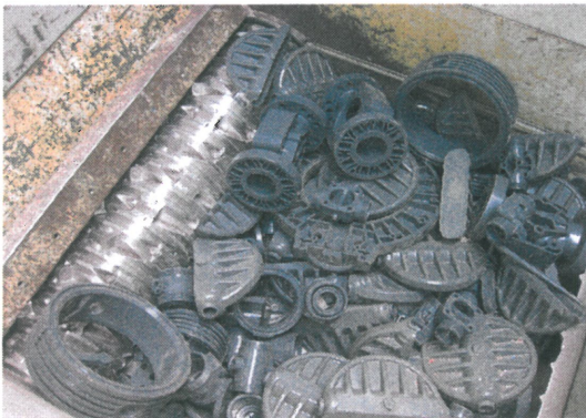
Das zu verarbeitende Material: HDPE, PVC, PTFE und PP Formteile, Profile sowie Brocken